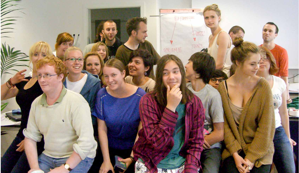
POLIPEDIA.EU WURDE IN WORKSHOPS MIT JUGENDLICHEN AUS ÖSTERREICH UND SLOWENIEN ENTWICKELT

(Schuldemanagement, Europawahl, Umbruch im arabischen Raum, Demokratie und Internet) veranstaltet. Die Ergebnisse aus diesen Treffen wurden zu Beiträgen für die neue Seite verarbeitet.